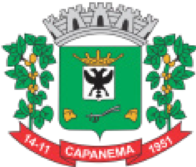
Logo Oficial do Município de Capanema-Pr